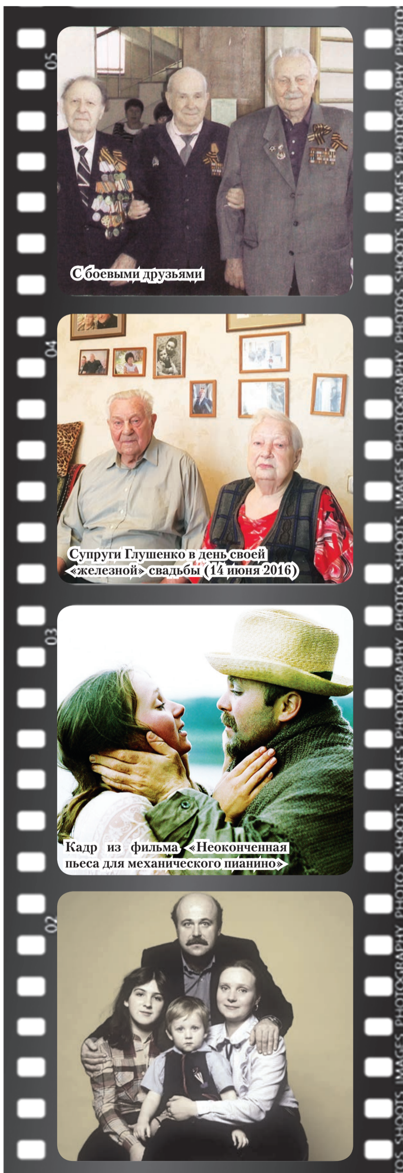
С боевыми друзьями