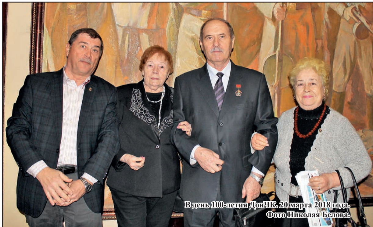
В день 100-летия ДонЧК, 20 марта 2018 года.

Особенно запомнилась длительная, напряженная, полная то успехов, то поражений работа с душманским отрядом во главе с сильным и мужественным вождем, узбеком по национальности, по переводу этих заблудив-