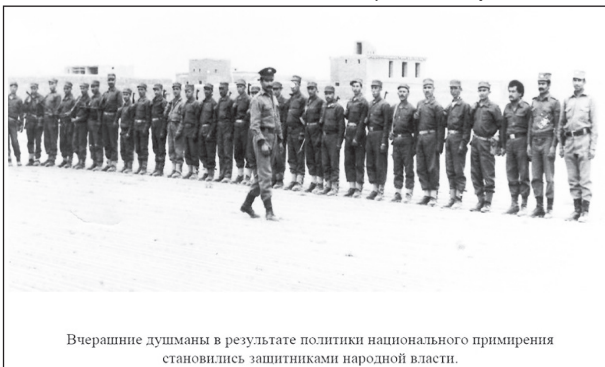
Вчерашние душманы в результате политики национального примирения становились защитниками народной власти.

Сегодня полностью подтвердилось правильность оценки советским руководством политической, военной и оперативной обстановки на Среднем Востоке в 1978 -1979 гг., серьезно грозившей геополитическим интересам СССР.