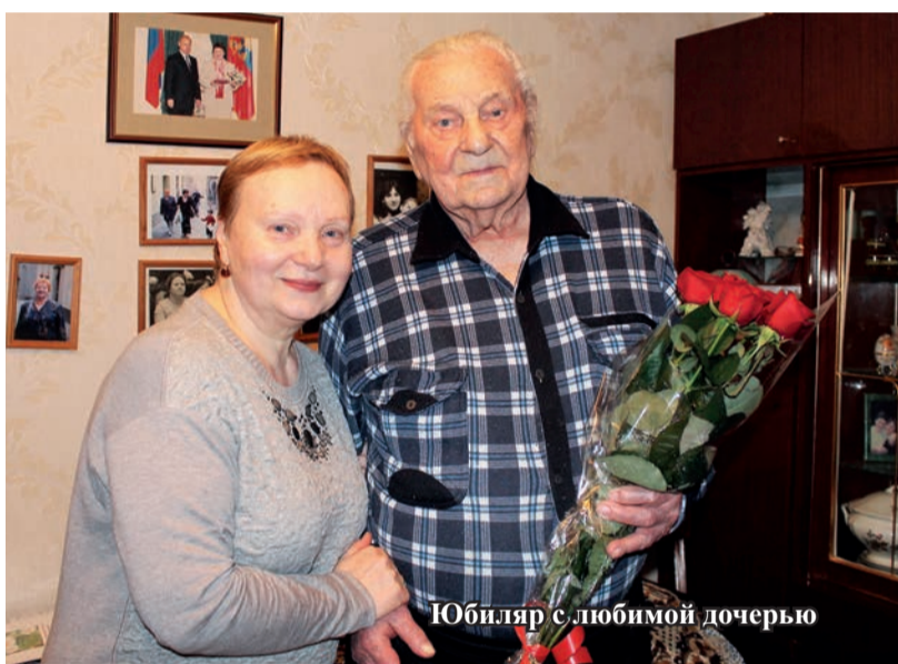
Юбиляр с любимой дочерью

и II степеней, «Знак Почета», полтора десятками медалей, в том числе и «За отвагу».