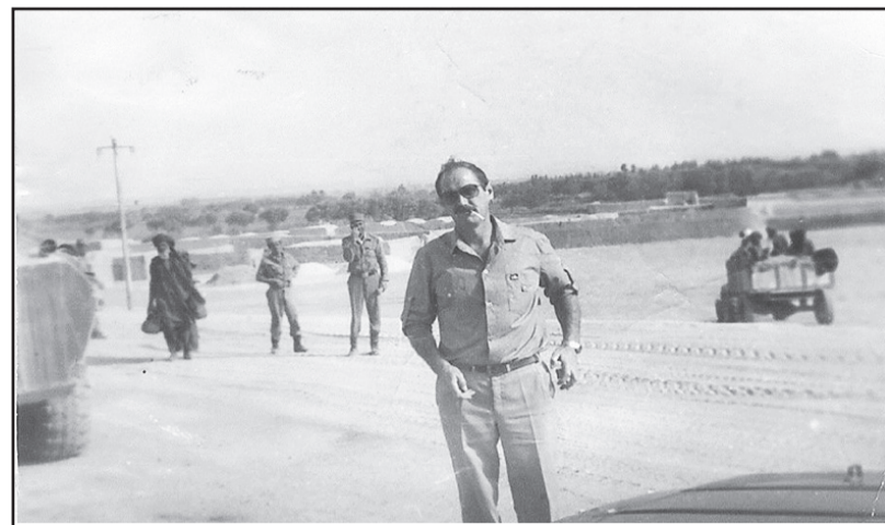
Афганистан. Перевал между аэропортом и Кандагаром.

В результате общих усилий целый район провинции Фарьяб оказался свободным от войны, свободным для торговли, свободным для передвижения и общения людей. Однако, внутреннее колебание узбека, происки за-