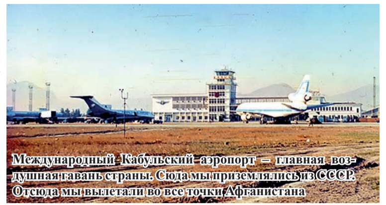
Международный Кабульский аэропорт – главная воздушная гавань страны. Сюда мы приземлялись из СССР. Отсюда мы вылетали во все точки Афганистана

Сложная обстановка в Афганистане требовала постоянного присутствия в этой стране подготовленного подразделения специально-